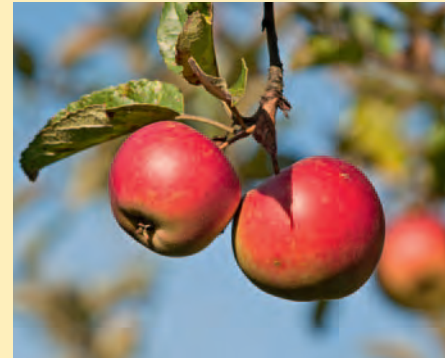
Symbol der Verlockung und des Sündenfalls: Ein Apfel vom Baum der Erkenntnis soll dafür verantwortlich gewesen sein, dass Adam und Eva das Paradies verlassen mussten.

Überhaupt ist die Sache mit Eva und dem Apfel alles andere als klar. Die verbotene Frucht, die am Baum der Erkenntnis hing, wird nämlich in der biblischen Schöpfungsgeschichte nicht namentlich genannt. Es könnte also genauso gut eine Feige gewesen sein, die im frühen Christentum als Symbol der Verlockung und des Sündenfalls galt. Spätestens ab dem 5. Jahrhundert nach Christus nahm allerdings der Apfel diese Rolle im abendländischen Kulturkreis ein.