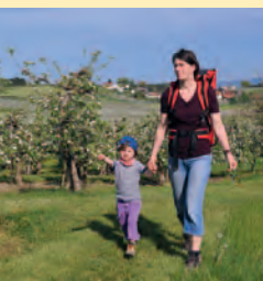
Auf der Wanderung im Hinterland von Wasserburg spaziert man an zahlreichen Niederstammanlagen vorbei.

Wirtschaftliche Aspekte lassen heute einen Anbau mit Streuobstbäumen kaum noch zu. Die Hochstämme weisen erstmals nach zehn Jahren einen nennenswerten Ertrag auf und sind in der Bewirtschaftung sehr arbeitsintensiv.