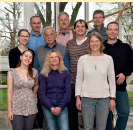
Die Arbeitsgruppe „Streuobst und Öffentlichkeitsarbeit“

Streuobstwiesen sind aus unserer Kulturlandschaft nicht wegzudenken. Sie liefern seit Jahrhunderten Obst, betten unsere Gehöfte und Dörfer harmonisch in die umgebende Landschaft ein und bieten dem Vieh Schutz bei Sonne und Regen. Nicht zuletzt finden mehrere 1000 Tier- und Pflanzenarten in den herrlichen, landschaftsprägenden Obstgärten wertvolle Lebensräume.