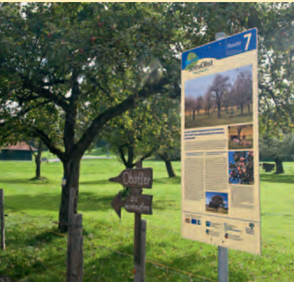
Auf großformatigen Informationstafeln werden entlang der Wanderwege verschiedene Aspekte der Streuobstwiesen erläutert.

Streuobstwiesen prägen unsere Landschaft und zählen zu den ökologisch wertvollsten Lebensräumen. Leider sind sie mittlerweile vielerorts stark gefährdet. Auf den sieben Streuobstwanderwegen zwischen Bodensee und Westallgäu werden diese artenreichen Lebensräume jetzt mit all ihren Besonderheiten vorgestellt. Dabei hat jede der sieben Routen ihren speziellen, ortstypischen Schwerpunkt. Mal geht es um Streuobst in den Hochlagen im Allgäu, mal um neue Chancen und Wege im Streuobstbau, mal um Bienen, Most und Brennerei. Daneben werden auch allgemeine Informationen zum Thema Streuobst auf anschaulichen Tafeln präsentiert.