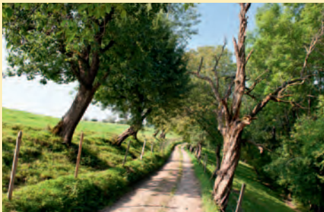
Die Streuobstwiesen in Gestratz-Altensberg beherbergen viele alte robuste Bäume, aber auch Totholz und junge Bäume säumen den Weg.

Der Herbst zeigt sich dann als Jahreszeit der Fülle: In manchen Jahren biegen sich die Äste unter der Last der reifen Äpfel, Birnen und Zwetschgen. In den Streuobstwiesen wird emsig gearbeitet und die Obstbauern bringen mit ihren Helfern die reiche Ernte ein. Bevor die kalte Jahreszeit beginnt, bereiten uns die Hochstämme noch ein besonderes Farbenspiel. Ihre Blätter verfärben sich in den schönsten Farben. Schließlich fällt das welke Laub zu Boden und die Obstgärten fallen in einen tiefen Winterschlaf.