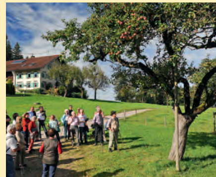
Die sieben Streuobstwanderwege im Landkreis Lindau sollen dazu beitragen, dass Streuobstwiesen mit ihren alten Hochstämmen auch in Zukunft unsere Landschaft prägen.

Streuobstwiesen sind im Rückgang begriffen. In der modernen Landwirtschaft kann Konkurrenzfähigkeit vielerorts nur noch durch Rationalisierung und Spezialisierung erreicht werden. Für eine extensive Landbewirtschaftung, für die auch unsere Streuobstwiesen stehen, bleibt da nur wenig Platz. Doch ein steigendes Umweltbewusstsein, Vermarktungsinitiativen und staatliche Förderungs- und Schutzprogramme lassen hoffen. Es wurde erkannt, dass mit dem Verschwinden der Streuobstwiesen über Jahrhunderte entstandenes Wissen, aber auch eine schier unerschöpfliche genetische Vielfalt und ökologisch äußerst wertvolle Lebensräume unwiederbringlich verloren gehen. Vom Schaden für unser Landschaftsbild ganz zu schweigen.