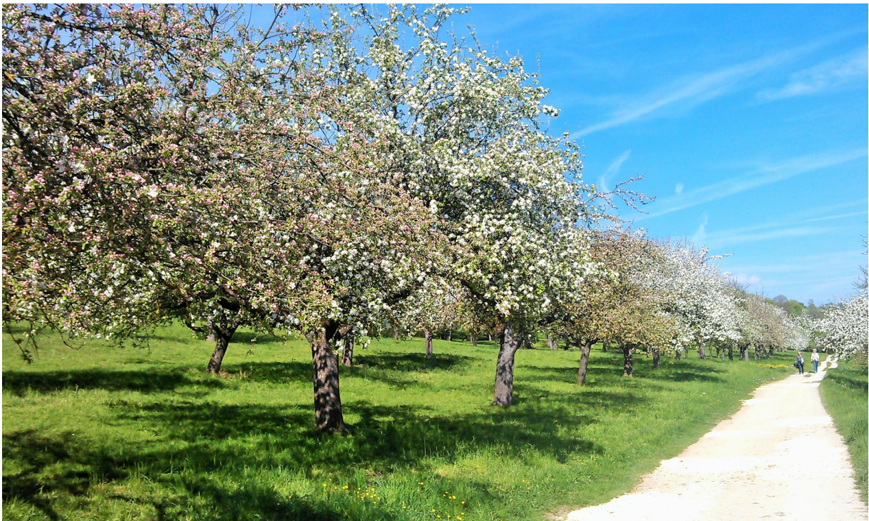
Ansichten vom Nürtinger Umland / Region Stuttgart