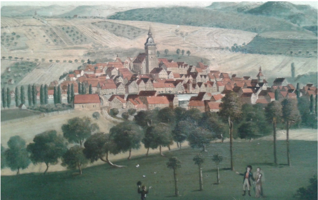
Aus einer Nürtinger Ansicht des 18. Jahrhunderts / Original im Stadtmuseum Nürtingen